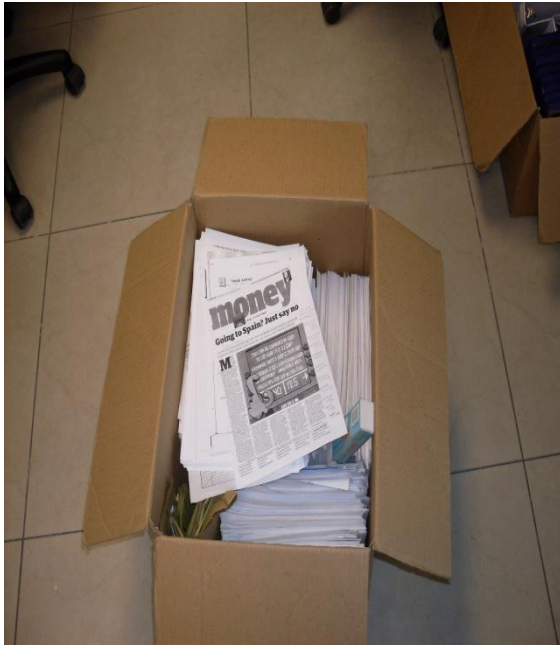
EN LA ETAPA DE CLASIFICACION