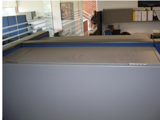
ANEXO 24. JORNADA DE AUTODISCIPLINA SEGUIMIENTO 5'S AREA DE CALIDAD